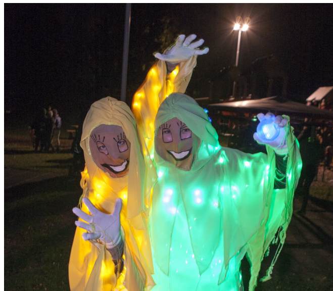
De senaste årens målmedvetna satsning på att utveckla Tibro som besöks- och boendeort fortsätter under 2015. Stadsparkspökerna och olika belysningsarrangemang lockade uppemot 4 000 personer till Tibro den 16 oktober 2014.

2014 lämnade kommunen in en ansökan om QM-certifiering, som syftar till att kvalitetssäkra och befästa arbetet med centrumutveckling, tillsammans med handeln och fastighetsägarna. Med QM-certifieringen som grund fortsätter arbetet med att bli nominerad till en av kandidaterna till utmärkelsen "Årets stadskärna 2017". Under året kommer en styrgrupp och en arbetsgrupp,