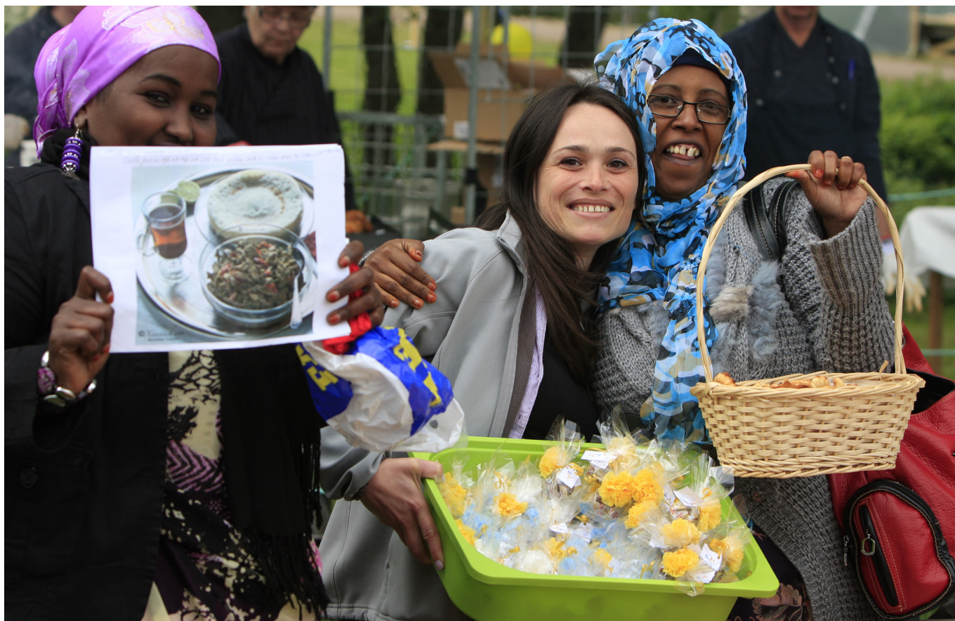
Under 2015 ska arbetet med kommunens integration av nyanlända utrikesfödda utvecklas. Bilden på de somaliska kvinnorna är från UPPÅNER-festivalen 2012.