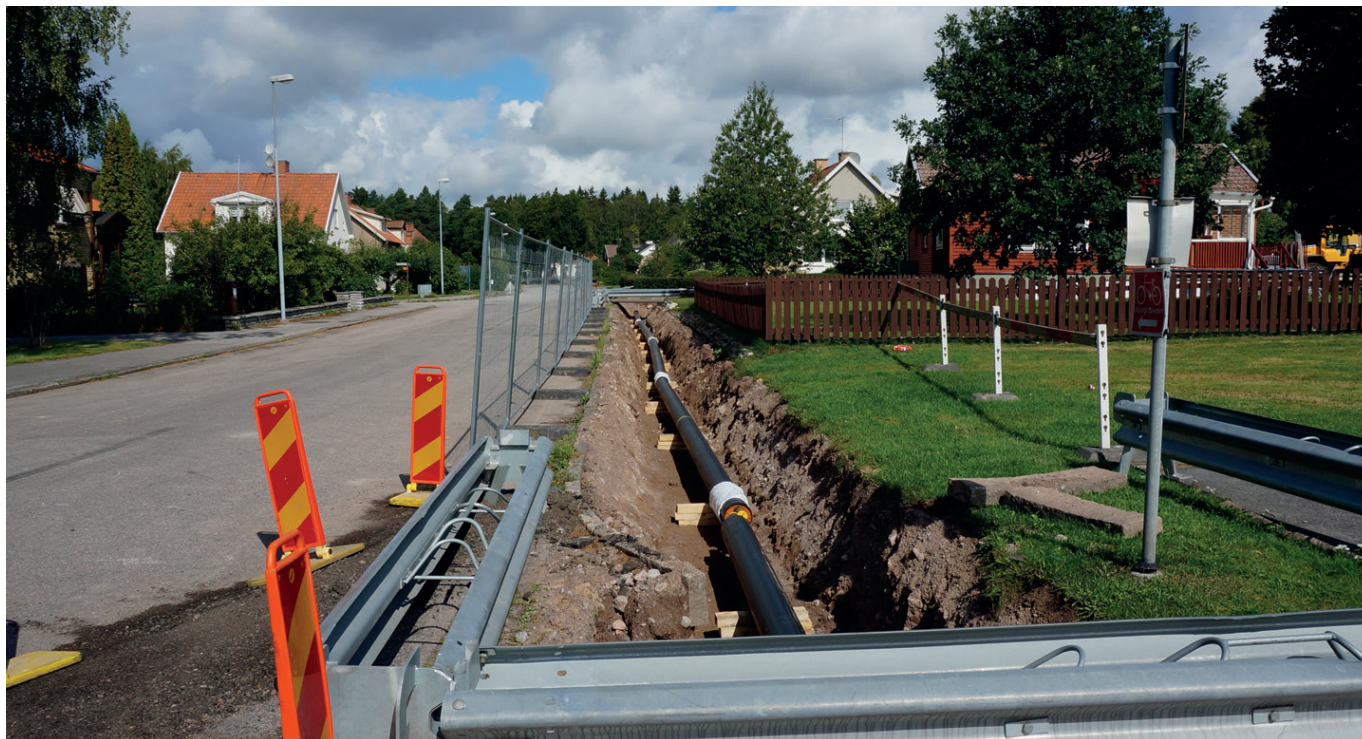
Under 2014 anslöts Häggetorpsskolan, Torpets förskola och ett 20-tal villor till fjärrvärmenätet.